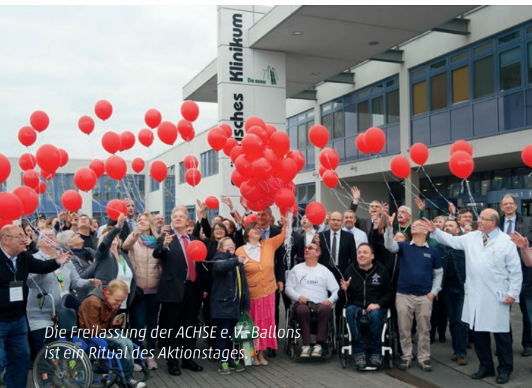
Die Freilassung der ACHSE e.V.-Ballons ist ein Ritual des Aktionstages

Akademisches Lehrkrankenhaus mit Hochschulabteilungen der Medizinischen Hochschule Brandenburg Theodor Fontane